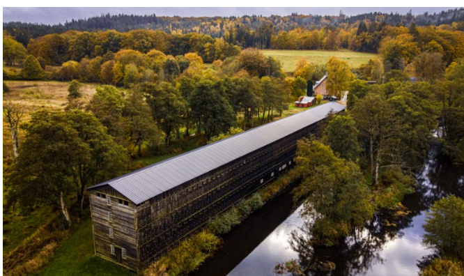
Klostermølle, Tørreladen, Danmarks længste træbygning