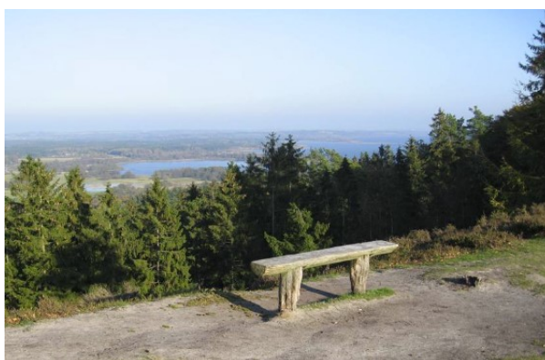
Udsigt fra Sukkertoppen (uden for turen)