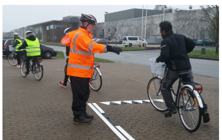
Cykelkursus for nye cyklister