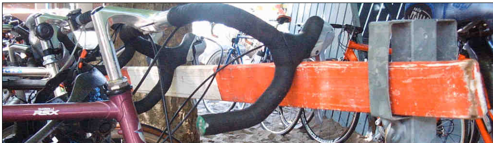
Cykelparkering ved Bornholm Rundt