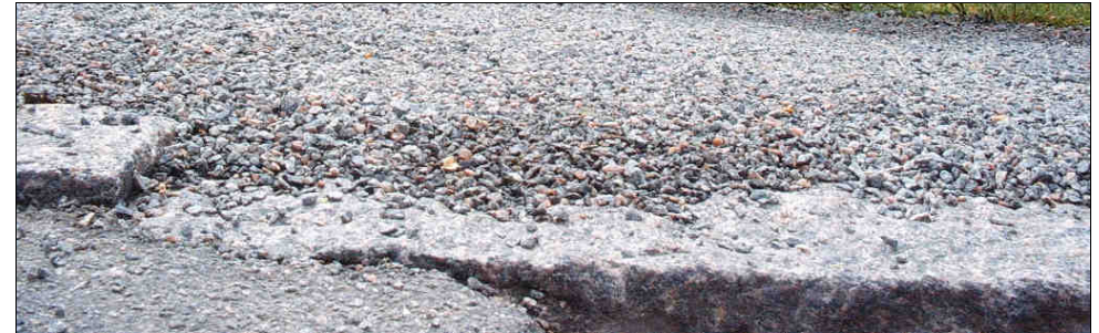
Billedet er fra cykelstien ud for Vestermarie Kirke

På vejbaner med skærver ligger skærverne ofte meget løst uden for hjulsporene, hvilket igen kan medføre, at cyklister trækker længere ud på kørebanen.