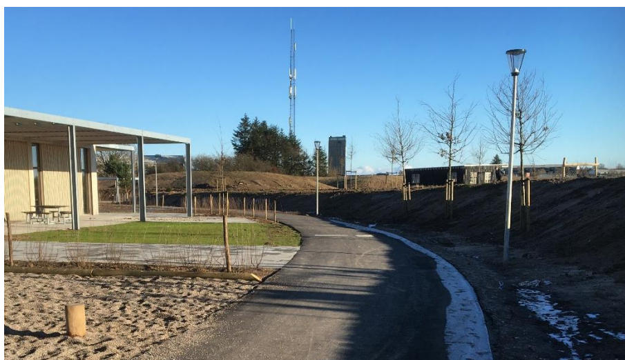
og rundt om skolen

På skolens grund er der lavet en offentlig cykel- og gangsti mellem vejen Erlev Bjerger og Hørregårdsvej med et cirkelslag rundt om skolen.