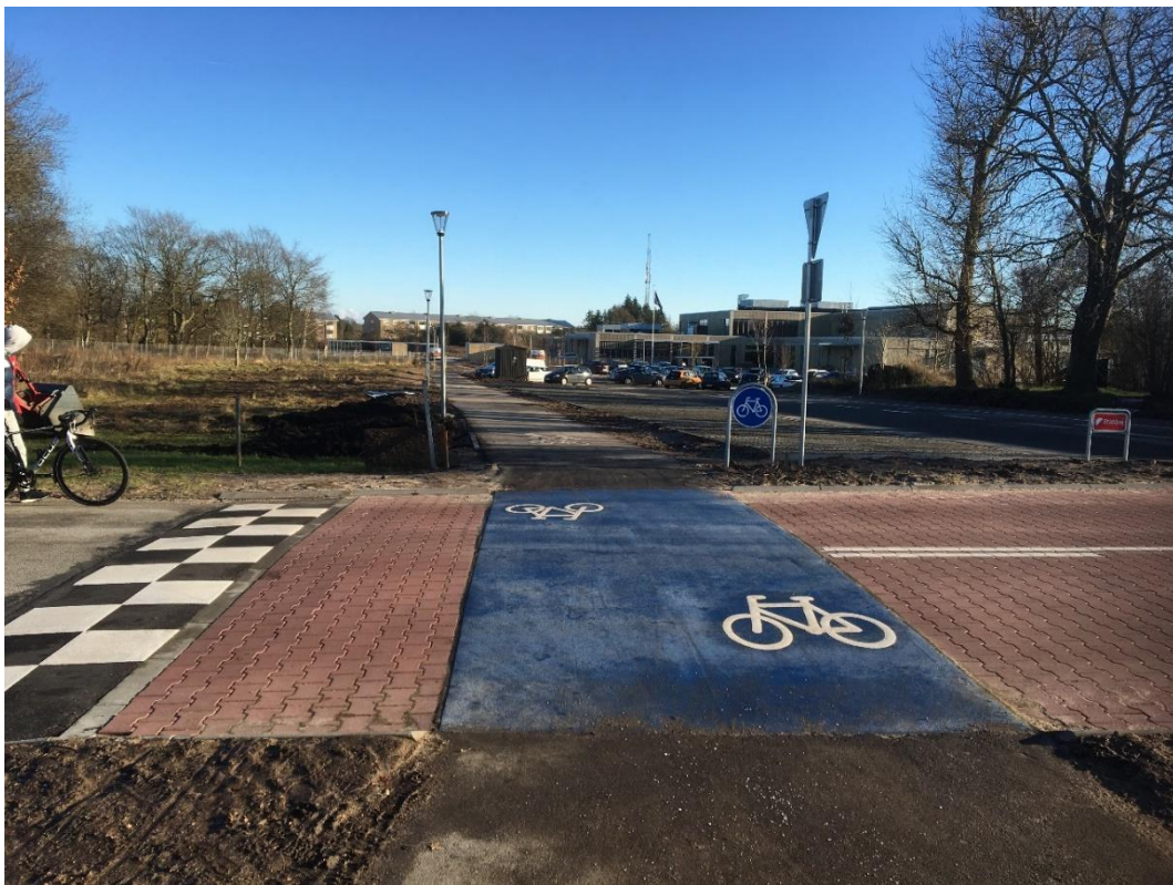
Nyetableret bump og overkørsel ved indkørslen til skolen fra Hørregårdsvej

Mens der er fine stiforhold inde omkring skolen, er der - som avisoverskrifterne antyder - stor betænkelighed ved elevernes krydsning af de omkringliggende veje, og der er bl.a. fremsat ønske om fartbegrænsning på vejene omkring skolen.