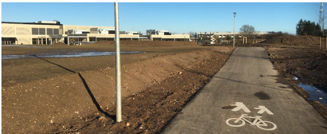
Stien fra syd til skolen