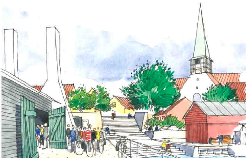
Den foreslåede passage på tværs af Munch Petersens Vej set fra havnen.

Men alene til den knap 1 km lange Munch Petersens Vej er der afsat 22 mill. kr. Det er et beløb, hvoraf man kan lave ca. 15 km cykelsti på landet.