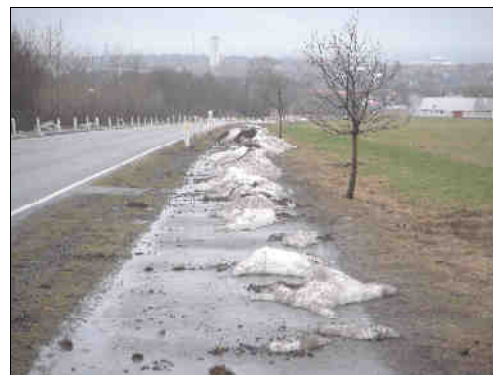
Foto 5. februar 2011 Her ses den cykelsti, der ikke blev ryddet.

Efter de enorme snemængder i december blev det slut med snerydning på de cykelstier uden for byerne, som hidtil var blevet ryddet.