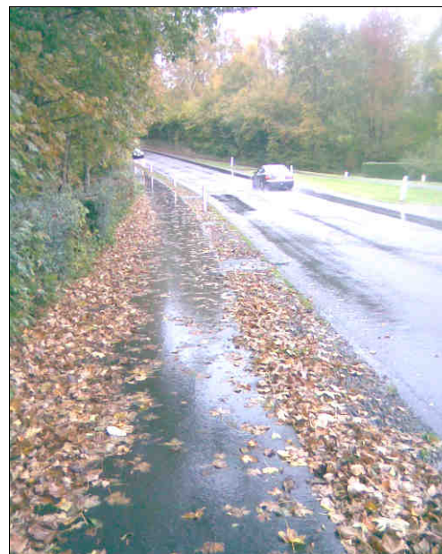
Cykelsti, cykelvej og fortov i Muleby.

Det eksisterende cykelvejnet trænger til at blive gjort færdigt. På flere strækninger er der kun kantbaner eller kun cykelsti i den ene side, og det er ikke planens hensigt at ændre til det bedre.